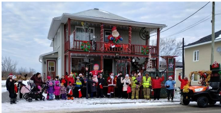
Photo de la Guignolée 2023